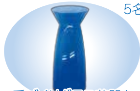
手づくりガラス花器を 5名様にプレゼント!! (提供：菅原工芸硝子)