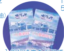
入館招待券をペアで 5名様にプレゼント!! (提供：太陽の里)