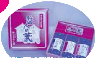
和風調味料詰め合せを 5名様にプレゼント!! (提供：大高醤油)