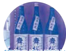
「舞桜こだわり純米」を 5名様にプレゼント!! (提供：守屋酒造)